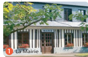
1 La Mairie