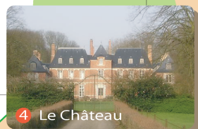
4 Le Château