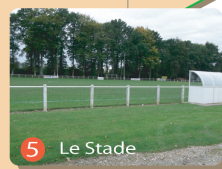
5 Le Stade