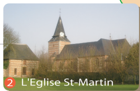
2 L'Eglise St-Martin