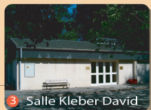
3 Salle Kleber David