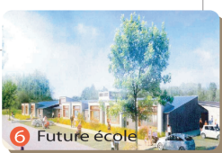
6 Future école